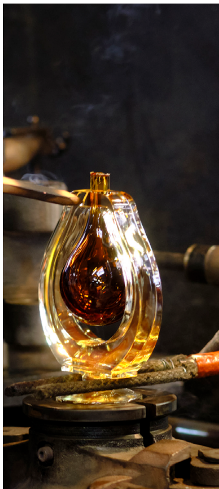
Das einzigartige Know-how der Glasmacher von Lalique ist die Seele des Unternehmens.